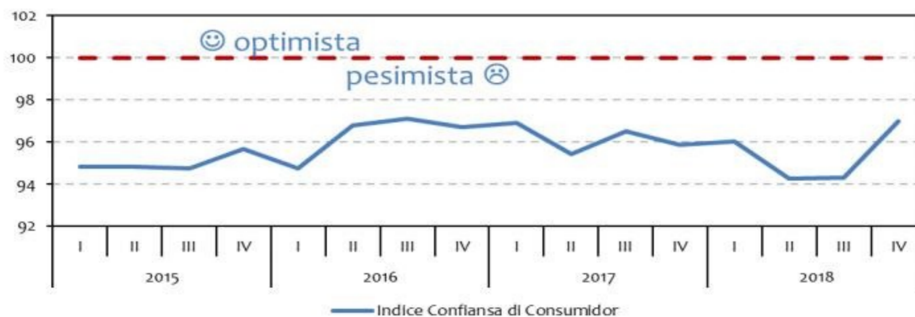
Grafiek 1: Indice Confianza di Consumidor

Sentimento di consumidor a mehora den e ultimo trimester di 2018, resultando den un Indice di Confianza di Consumidor di 97,0, un aumento di 2,7 punto di indice compara cu e periodo anterior, segun e ultimo resultadonan di e Encuesta di Confianza di Consumidor (CCS) 2 di Banco Central di Aruba (Grafiek 1) 3 .